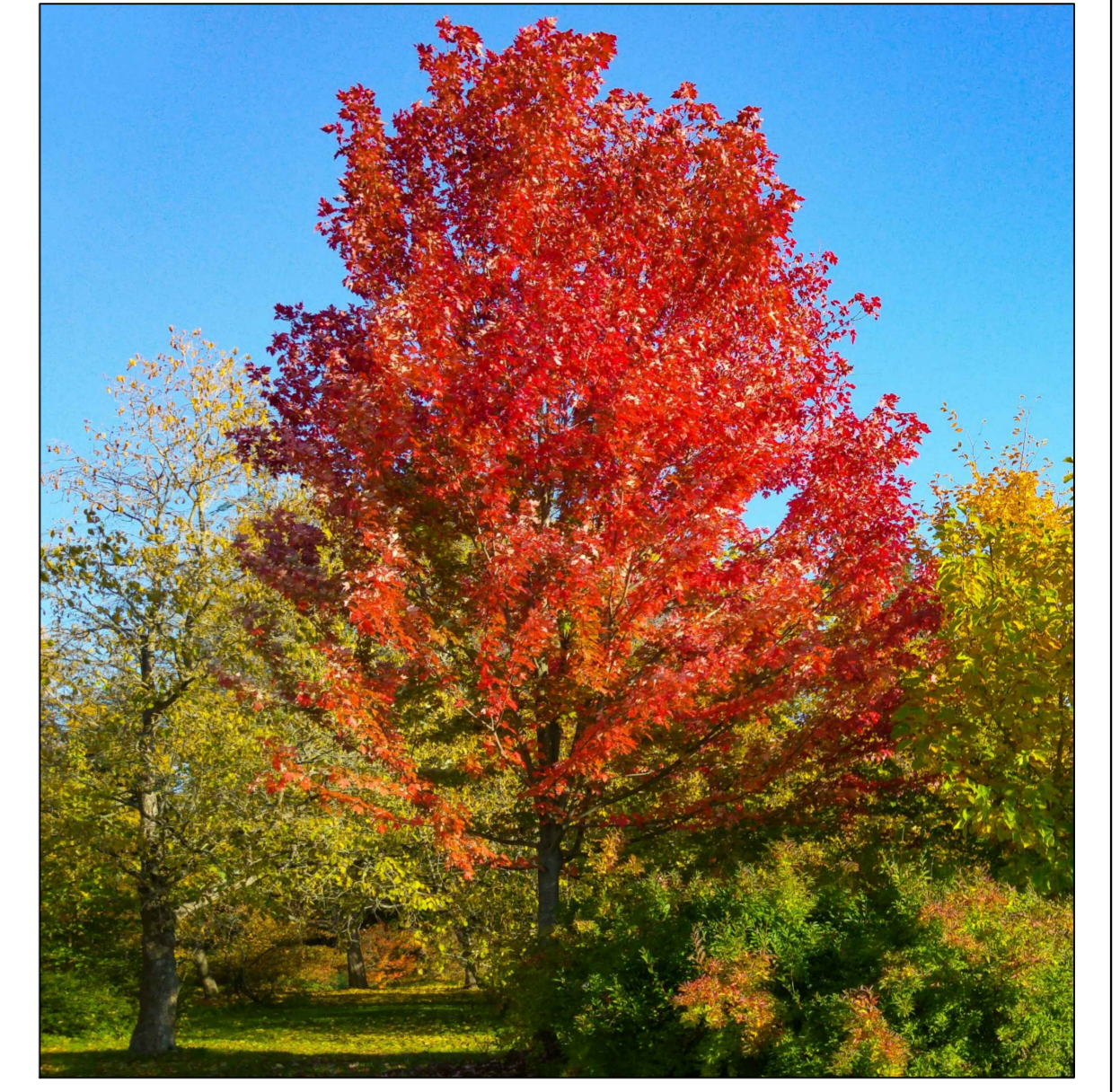
1. Acer platanoides 'Autumn Blaze' Noorse esdoorn