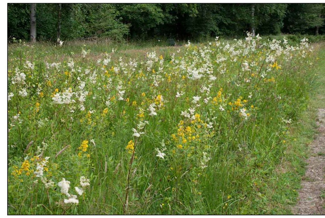
Berm/Wadi Kruidenmengsel, G3, Cruydt Hoek