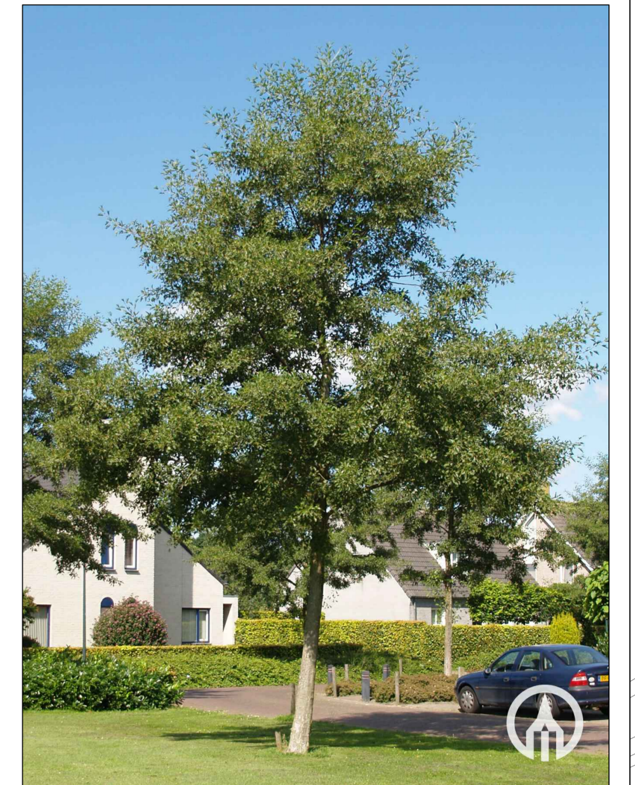
2. Alnus glutinosa 'Lucinata' Zwarte els