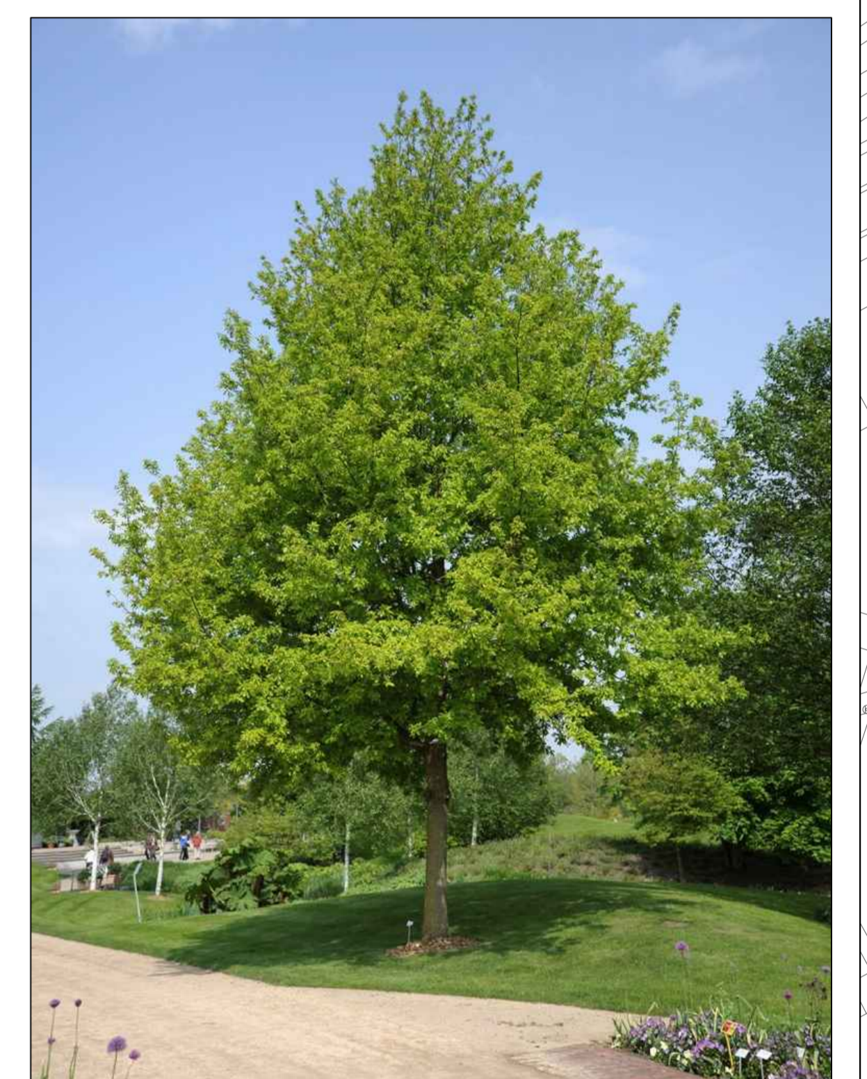
3. Quercus robur Eik