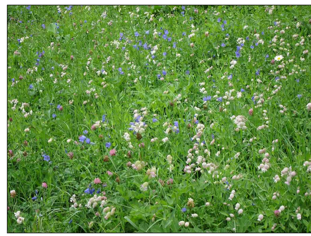
Middengeleider Bloemrijk graslandmengsel, M4, Cruydt Hoek