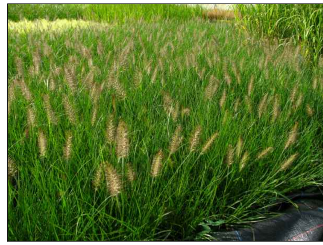
Middengeleider Pennisetum 'Little Bunny'