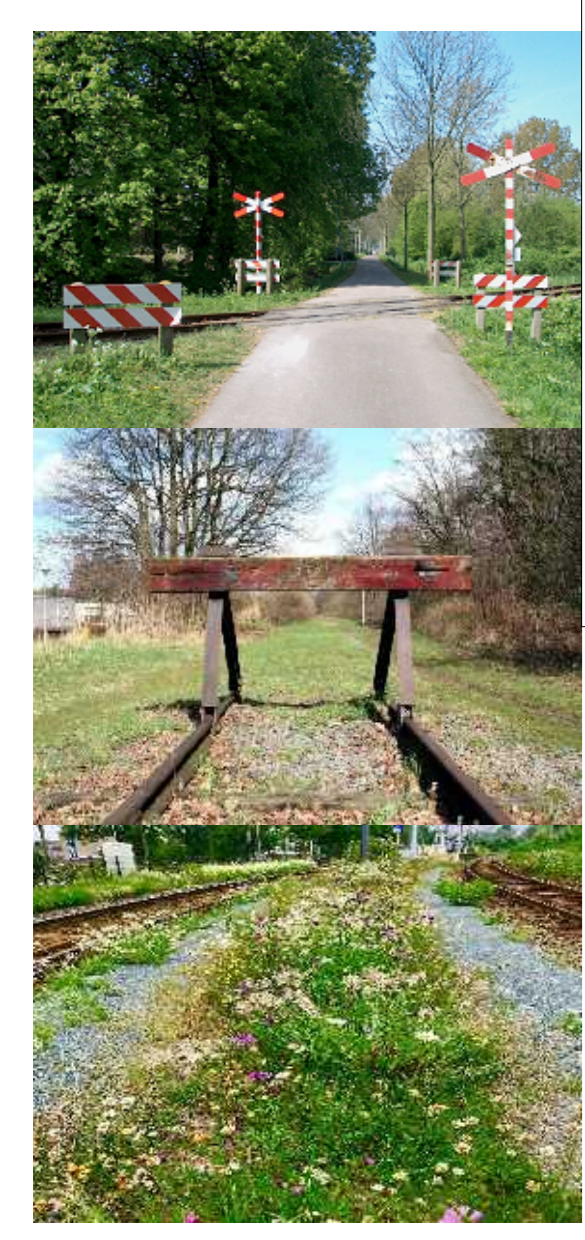
Spoorbaan met treinblok en seininstallatie Busopstapplaats