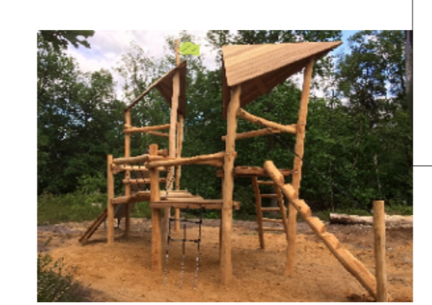
Speelelement, nader te bepalen